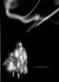
Pepe Arbelo / Domingo Mesa