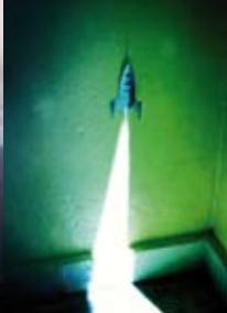
Ramón del Pino