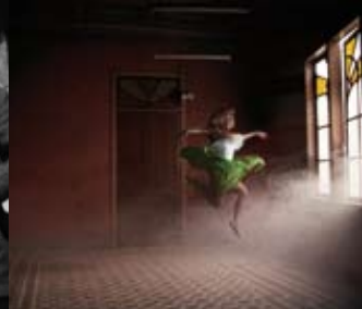
Colectivo Shutters Tenerife