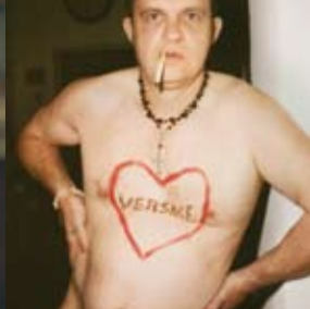
Daniel Wetzel / Gregor Schuster

30 Del 11 de noviembre al 10 de diciembre de 2013